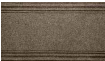
Nuvola | APS2541