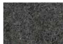
Antracite APV2549 - h. 2 m