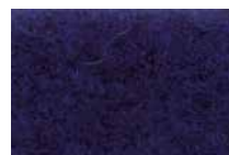
Notte APV2545 - h. 2 m APS543 - h. 1 m