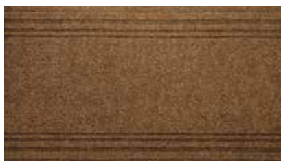
Bruciato | APS518