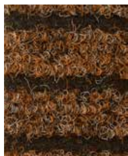
Bruciato APV561 - h. 2 m APS525 - h. 1 m

Composizione: 100% fibra polipropilenica Supporto di coesione: Lattice sintetico Peso totale: 1700 gr/mq \pm 10% Spessore: 7 mm \pm 10% Dimensione rotolo: Altezza 1/2 m - Lunghezza 25 m Impiego: Abitazioni, allestimenti fieristici, locali pubblici, show-room