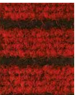
Rosso APV557 - h. 2 m APS521 - h. 1 m