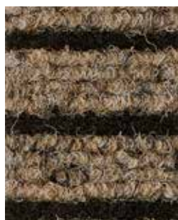
Beige APV560 - h. 2 m APS524 - h. 1 m