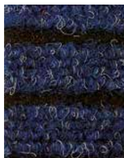
Blu APV559 - h. 2 m APS523 - h. 1 m