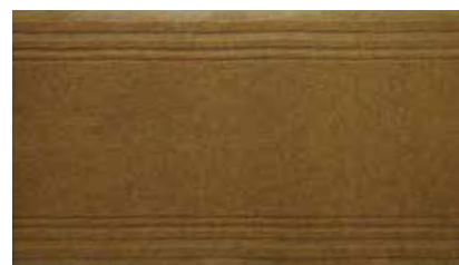
Oro | APS2542