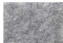
Grigio chiaro APV2546 - h. 2 m