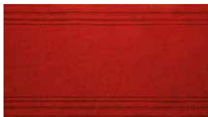
Rosso | APS515