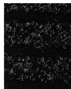
Antracite APV564 - h. 2 m APS528 - h. 1 m