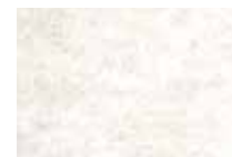
Bianco APV 613 - h. 2 m APS546 - h. 1 m