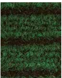
Verde APV558 - h. 2 m APS522 - h. 1 m