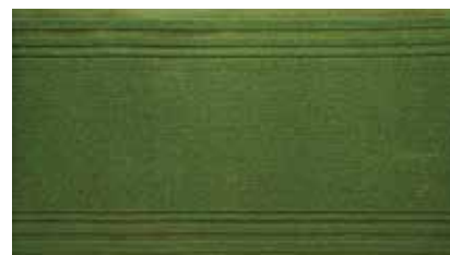
Verde | APS2543